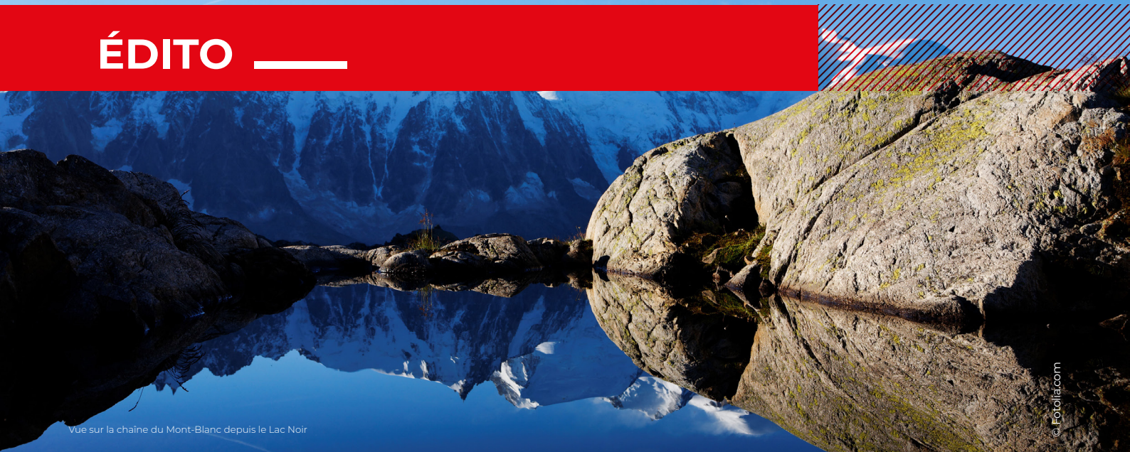
Vue sur la chaîne du Mont-Blanc depuis le Lac Noir