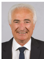
Marcel Cattaneo Conseiller départemental du canton de Faverges-Seythenex