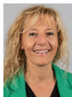
Agnès Gay Conseillère départementale du canton de Bonneville